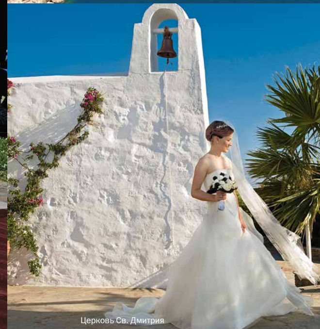
Церковь Св. Дмитрия

Источая ауру изысканности и элегантности, этот превосходный резорт сочетает в себе уединение и неподдельное гостеприимство с космополитической жизнью столицы.