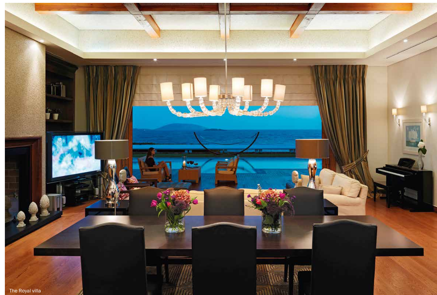
The Royal villa

40th km Athens-Sounio Ave. 190 10 Lagonissi-Attica-Greece grandresort@grandresort.gr www.grandresort.gr G.N.T.O. License 0208K045A0185900