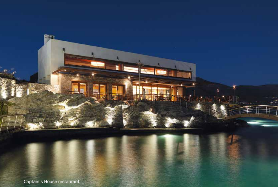
Captain's House restaurant

Гостям для размещения в отеле предлагаются сьюты, бунгало и виллы с зеленым садом и прекрасным видом на залив или просторными балконами, выходящими на Эгейское море.